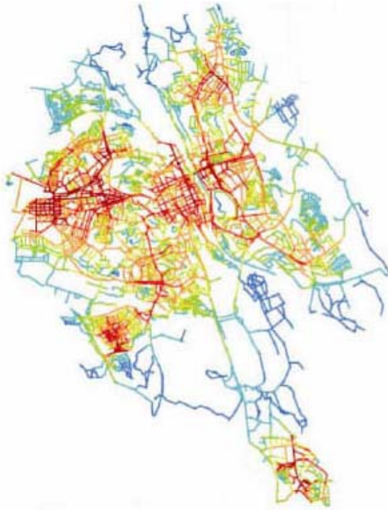
Рис. 3. Город Седертэлдж (Радиус интеграции 15)

Радиус исследования городского пространства уменьшен до 15 единиц (Рис. 3), в результате чего появляется другая схема - выделяется несколько новых узлов интеграции . Интеграция на этом уровне показывает более сильное тяготение от ядра на запад и восток, а также указывает на привлечение людей из других частей города. У некоторых областей есть ярко выраженное ядро, в то время как в других довольно трудно идентифицировать "главную улицу" или "центральный квадрат". Такая пространственная иерархия, кажется, влияет на жителей с точки зрения изоляции. Тем не менее, пространственная иерархия оказывает благоприятное воздействие на некоторые районы, в то время как другие оказываются в более неблагоприятном положении с такими свойствами (Varidy 2005, цитируется по [2]).