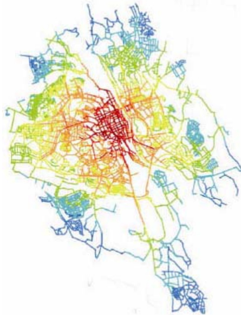
Рис. 2. Город Седертэлдж (Радиус интеграции n )

Рассматривался шведский город Седертэлдж (Södertälje). Пространственная модель (карта), включающая в себя весь город. Анализ глобальной интеграции (радиус n – см. Рис. 2) ясно показывает, что Седертэлдж (Södertälje) имеет четко определенные ядра с высокой степенью интеграции. Более тесная интеграция происходит в направлении на запад и юг, чем на восток и север. Несколько высоко интегрированных линий простираются от ядра наружу. Район более тесной интеграции – это, как правило, городское ядро, по сравнению с периферией, где эти процессы намного слабее. Есть также некоторые пространственно изолированные области, которые находятся на удивительно близком географическом расстоянии от центра города (здесь идет речь о пространственной интеграции, которая определяется параметром доступности (время) /связанности (люди)).