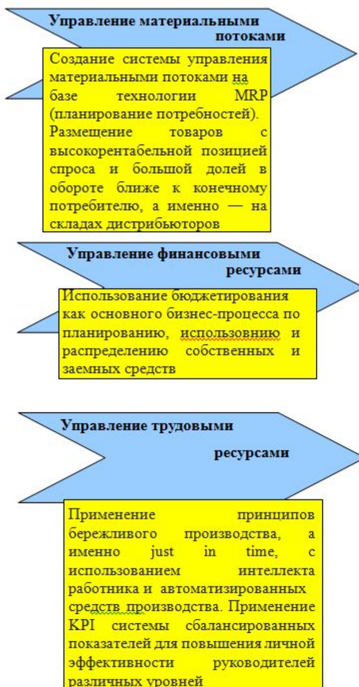
Рисунок 3. Три направления развития производственных и логистических систем

На рисунке 3 представлены организационные мероприятия и подходы к развитию производственных и вместе с ними логистических систем, которые распределены по трем направлениям в области организации движения материальных